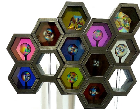
„CapsuleHotel“ 2024, Kunst-Werk-Raum Untermieming