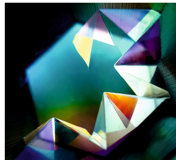
„Origamovie“ 2024, Kunst-Werk-Raum Untermieming